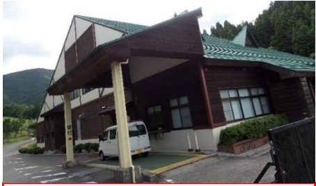
管理棟 (浸出水処理施設)