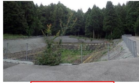
調整池 ※土地利用不可